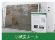
⑦減災ホール 清洲城跡からみつけた天正地震(1586年)による液状化の痕跡です